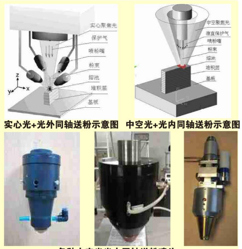
各种中空激光光内送料增材制造工

激光加工按是否增材而分为2种, 一种是激光直接辐照加工, 另一种就是增材熔覆加工, 增材方式有多种, 其中同步送料是更先进, 难度也偏大的一种增材加工方式, 这其中, 同步送料的光料喷射方式及其喷头是激光增材加工的关键技术与重要装备之一。我们研究中空激光光内送料增材制造工