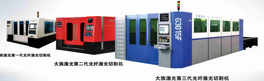
大族激光第一代光纤激光切割机